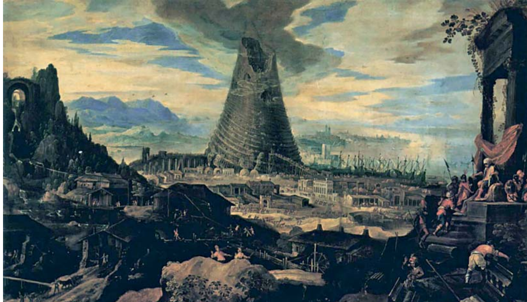
«« «Turmbau zu Babel», Lodewyk Toeput, 1585. Lodewyk lässt offen, ob der Turm im Bau oder als Ruine dasteht. Die düstere Szenerie und die über dem Turm hängende Wolke lässt nichts Gutes ahnen.

Ein Turmbau in Form einer Zikkurat, einer Stufenpyramide, ist im alten Babylon archäologisch nachgewiesen. Sein erstbezeugter Name Etemenanki wird übersetzt mit Haus des Himmelsfundaments auf der Erde . Der wohl über 90 m hohe Bau mit vermutlich sieben Plattformen steht für das Leistungsvermögen einer Gesellschaft, in einer steinlosen Ebene ein solches Bauwerk errichten zu können.