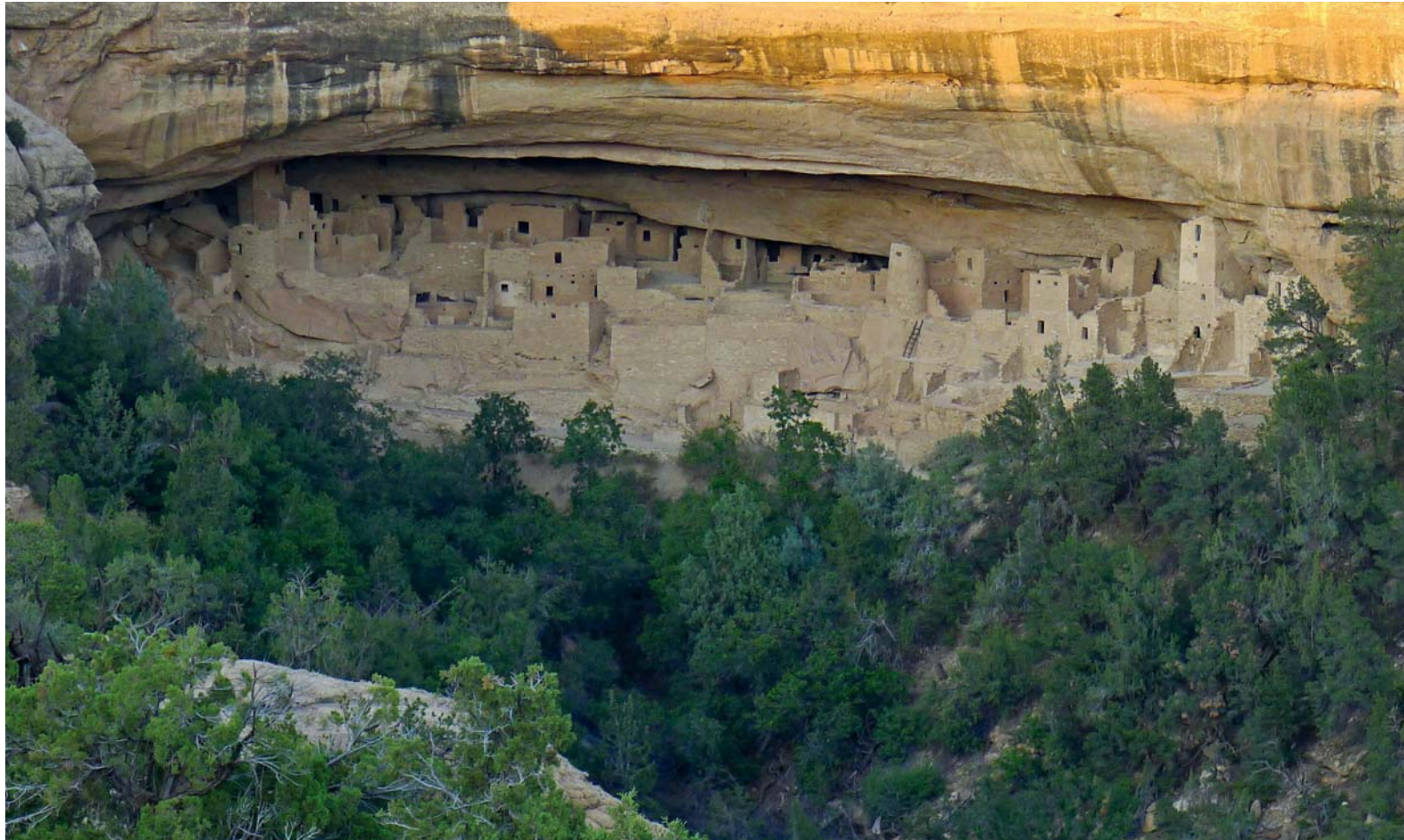
86 «« USA, Colorado, Chapin Mesa, Cliff Palace. Die eindrücklichste Ruine der Mesa Verde umfasst gegen 200 Wohneinheiten. Das Bild ist am Standort aufgenommen, von welchem aus Richard Wetherill und Charlie Manson erstmals ein Cliff Dwelling zu sehen bekommen.

VON DER ALLMÄHLICHEN ERKENNTNIS, NICHT DIE ERSTEN ZU SEIN: